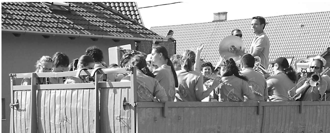
A Martonvásári Fúvószenekar zenés felvonulással hívogatott az ünnepre