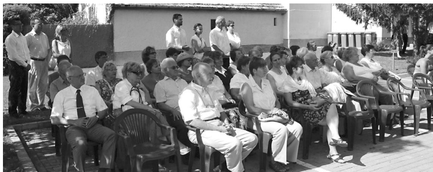
Az ünneplők egy csoportja a Városháza udvarán