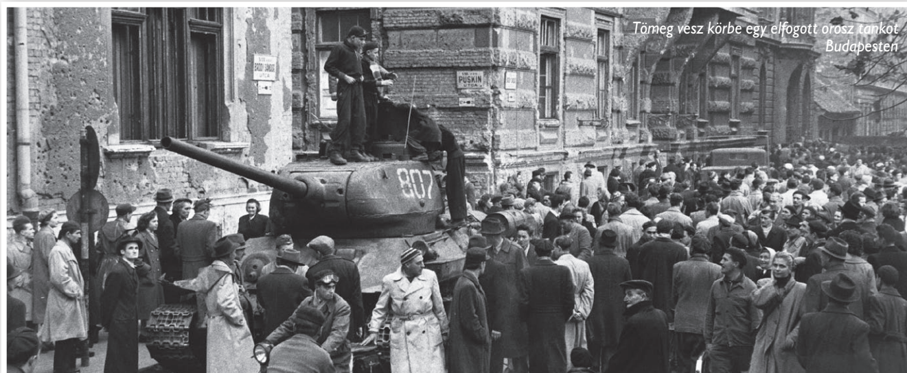
Tömeg vesz körbe egy elfogott orosz tankot Budapesten