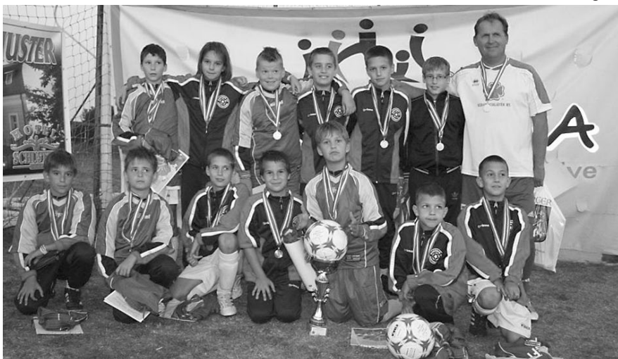
Kupagyőztes csapat Csengeren