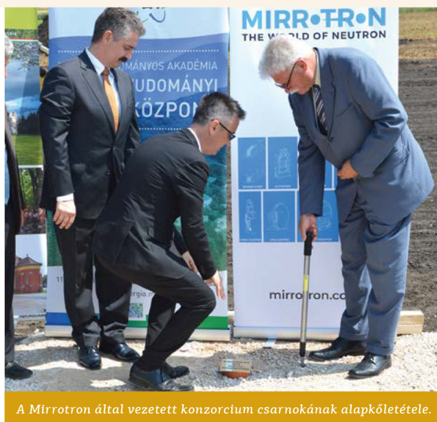
A Mirrotron által vezetett konzorcium csarnokának alapkövetétele.

Higgyék el ezeken a dolgokon csak mi saját magunk változ-