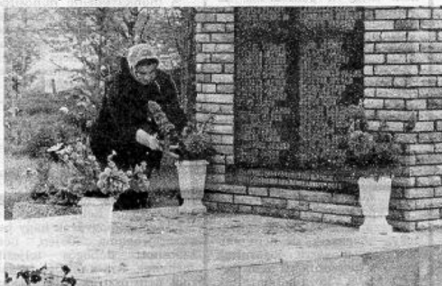
Szabadegyházán a virágok és az emlékek nem hervadnak