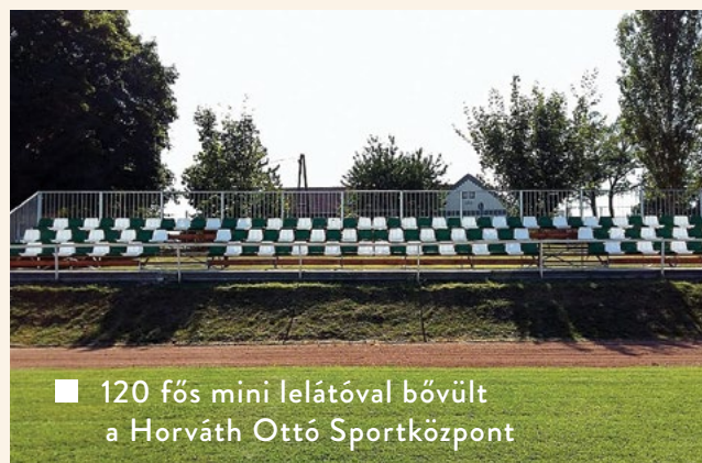
■ 120 fős mini lelátóval bővült a Horváth Ottó Sportközpont

A megállapodás fejében önkormányzatunk vállalta, hogy karbantartja a területet, biztosítja a szolgálati lakások megközelíthetőségét, elvégzi a hóeltakarítást, illetve előre egyeztetett időpontokban biztosítja a vasúti rakodáshoz szükséges teret is. A közcélra megnyitott nyilvános parkoló üzemeltetési feladatait a Martongazda Nonprofit Kft fogja ellátni.