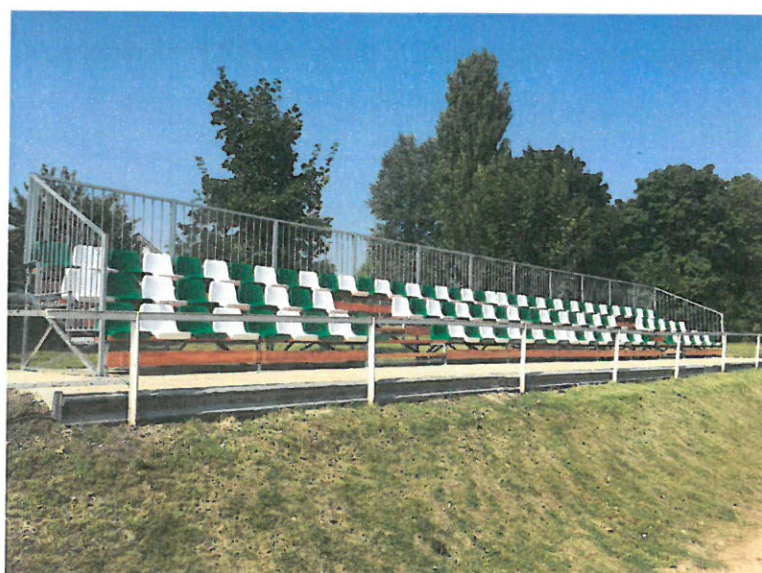
3. Lelátó a labdarúgó pálya mellett (1M)

A handwritten signature in blue ink, consisting of a stylized 'R' followed by a horizontal line.