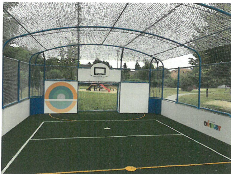
1. OVI-SPORT pálya