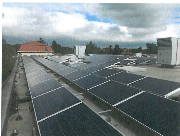
2. Napelempark a Tóth Iván Sportcsarnok tetején (6M)