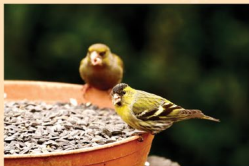
A csíz, és a hátlérben látszó zöldike napraforgómagot lakmározik.