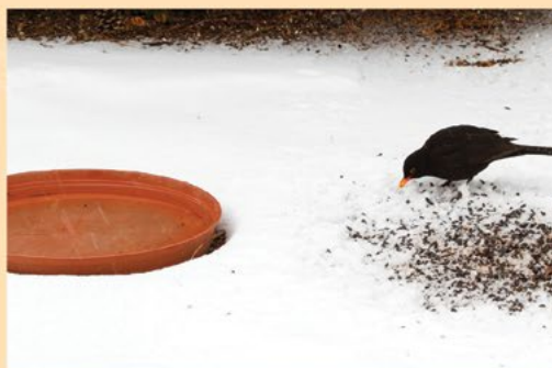
A fekete rigó, miután a földről csipegetett, a kitett itatóból juthat folyadékhoz.