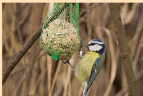
A kék cinege a cinkegolyóból csipegetve jut zsiradékhoz.