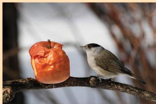
A barátposzátó a fa ágára tűzött almát dézsmálja.