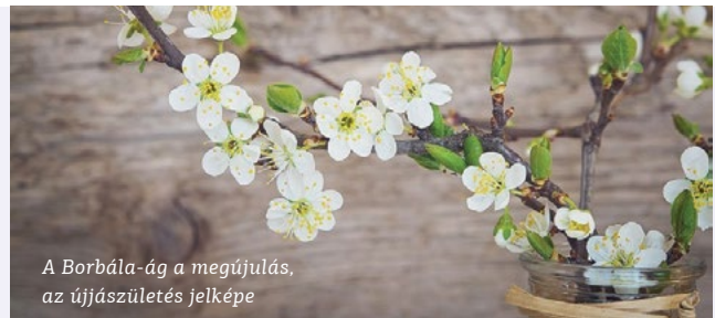
A Borbála-ág a megújulás, az újjászületés jelképe

Az enyhe borongós nappalok azonban időt adnak néhány kerti munkára. Befejezhetjük az ásást, a tápanyag visszapótlását, a fatörzsek tisztítását, a fiatal csemeték védelmét. Az eddigi enyhe időjárás követheti zord hideg tél, nagy hó és ilyenkor a nyulak jobb híján a fiatal csemeték kergét rágják meg. A törzseket csavarjuk be újságpapírral vagy műanyag hálóval. Az idősebb fákat meszeljük be, ami a téli napsütés ellen véd. Folyamatosan etessük kertünk szorgos munkásait, az énekes madarakat. Az ablak közelébe állított madáretető érdekes megfigyelésekre ad lehetőséget. Ha eddig még nem tettük meg, víztelenítsük a kerti csapokat és vezetékeket. Ellenőrizzük az őszi telepítések és a rózsák földkupacait, ha