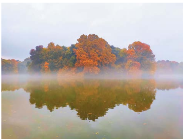
↓ Majláth Imre