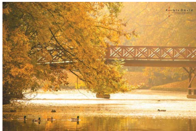
↑ Kortyis Dávid