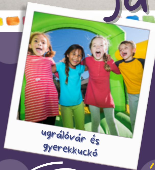
ugrálóvár és gyerekkuckó