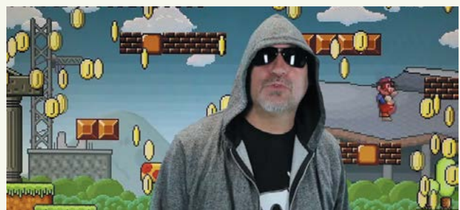
A felcsúti jelölt a humorra esküszik