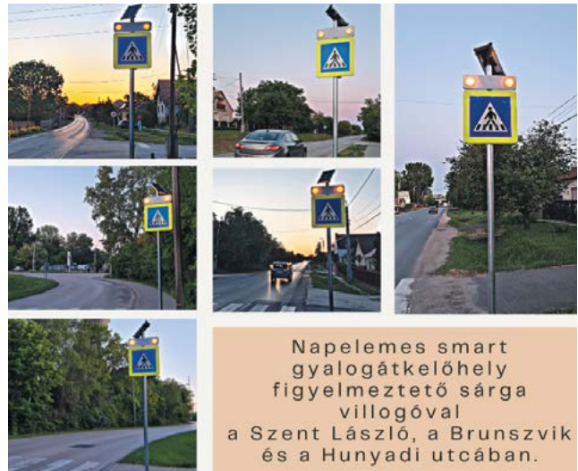
Napelemes smart gyalogátkelőhely figyelmeztető sárga villogóval a Szent László, a Brunszvik és a Hunyadi utcában.