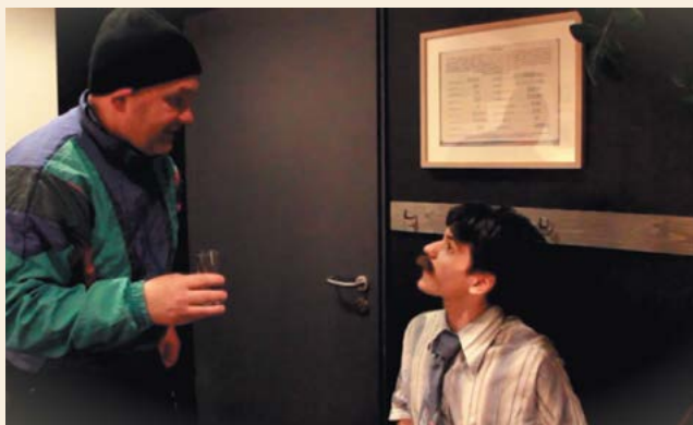
Egy régi Bitó-Kozma-émlék. Ha kell, tudnak magukból bohócot csinálni.

Az együttműködésből a MASZK Ken Ludwig – aki az egyik legnépszerűbb kortárs amerikai sztárszerző – Primadonnák című bohózatát mutatja be jövő év elején. „Az élet úgy hozta, hogy lehetőségem nyílt más színházaknál játszani, így évek óta nem léptem fel a BBK színpadán. Petivel már évek óta beszéljük, tervezzük, hogy csináljunk közösen valamit, hisz már hét éve nem álltunk együtt színpadon” – mondta la-