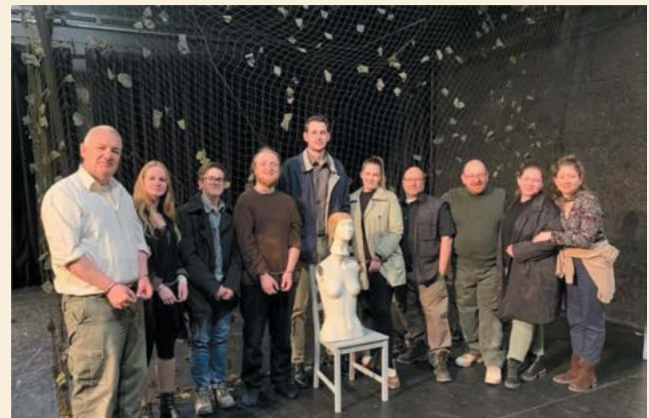
A Temetetlen holtak stábjja