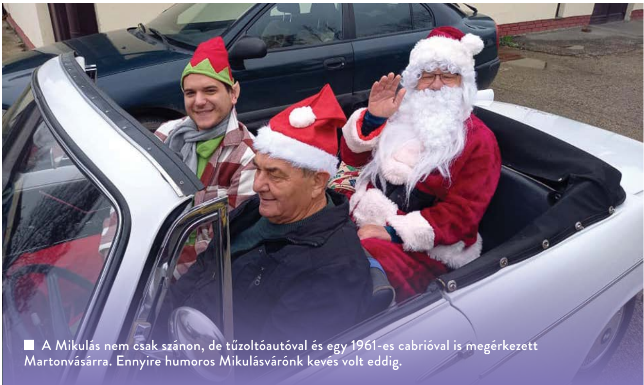
■ A Mikulás nem csak szánon, de tűzoltóautóval és egy 1961-es cabrióval is megérkezett Martonvásárra. Ennyire humoros Mikulásváróink kevés volt eddig.