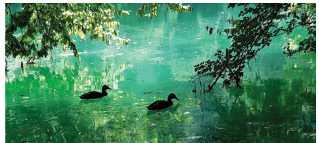
↑ Purnhauser Dorottya 7.a_ I. hely

Purnhauser Dorottya, 7.a, Jehoda-Gajdos Jázmin, 7.c III. Szíjártó Mihály, 7.d, Márhoffer Dávid, 7. b