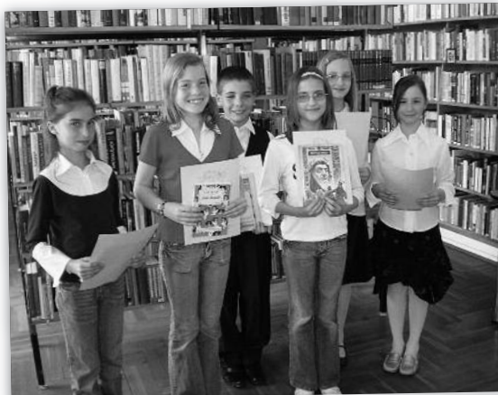
A szavalóverseny legügyesebbjei

„A rengő lomb virágban ég és készül a gyümölcsre,” (József Attila)