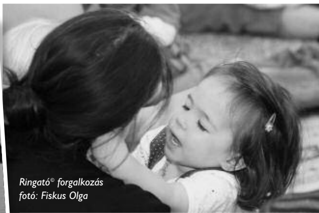
Ringató° foglalkozás

rint ölbeli játékokat játsszanak a kicsikkel is és még a nagyobb, óvodás gyerekekkel is boldogság. Ha látja a nagy, hogy a kicsi mekkorákat kacag, jön ő is, sőt később ő játszik a kicsivel – legnagyobb örömünkre.