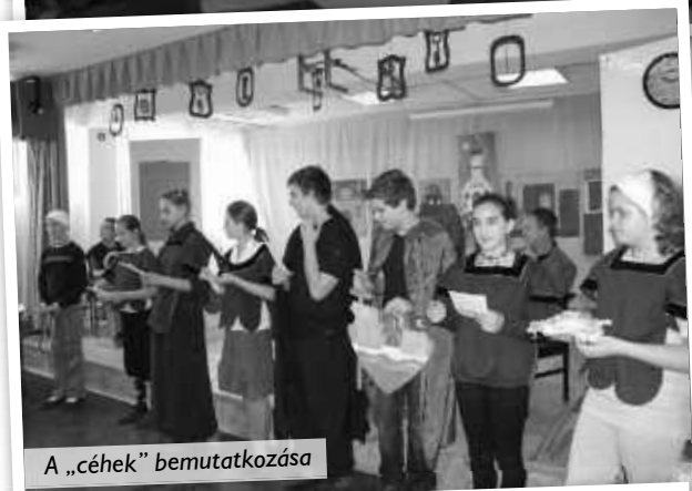
A „céhek” bemutatkozása