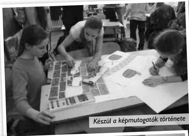
Készül a képmutogatók története

A kikiáltó nyitotta meg a vásárt, bevonultak a vásári mutatványosok, a gólyalábon járók, a