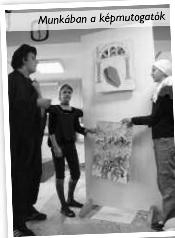
Munkában a képmutogatók