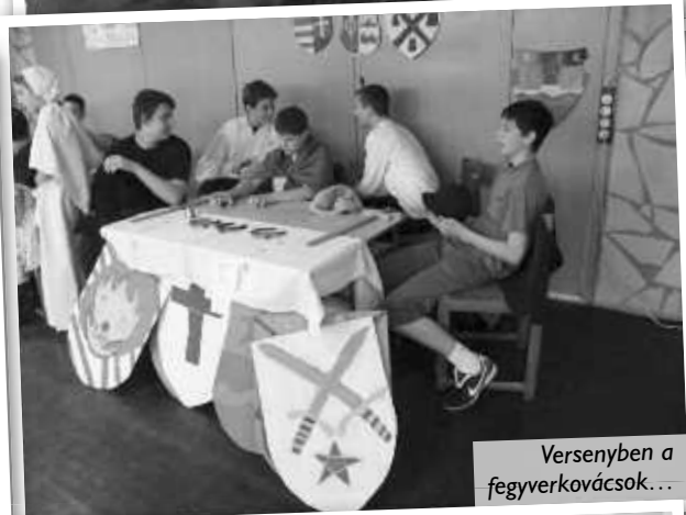
Versenyen a fegyverkovácsok...