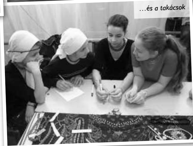
...és a takácsok

bűvész, majd mindenki versek segítségével kínált valamilyen portékát. Megelevenedett az igazságtalan Döbrögi története, vásári képmutogatók meséltek háborzongató történeteket. Ennek a korabeli vásári látványosságnak a bemutatása nem kevés előzetes munkát igényelt, hiszen a történet elmesélése mellé még sok képet is készítettek az arra vállalkozók. Ezután meglepetésként az udvarmester bejelentette, hogy