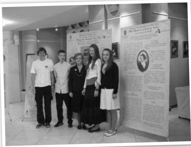
Csapatunk a győztes pályamunka előtt