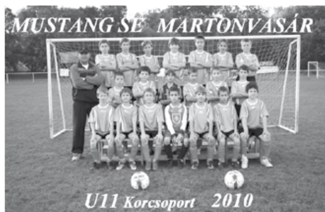
U11 Korcsoport 2010