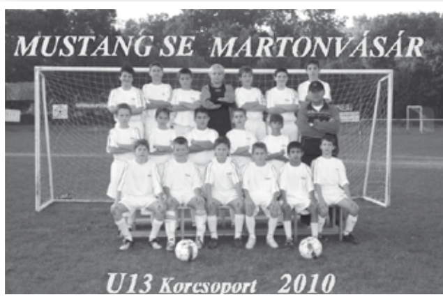
U13 Korcsoport 2010