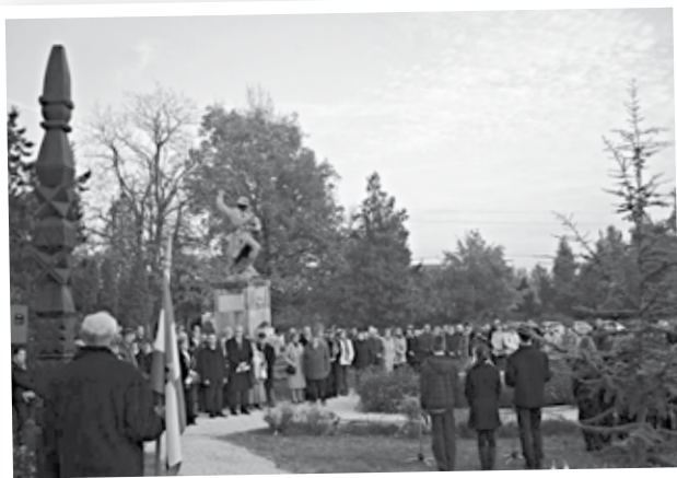
Szép időben ünnepeltük az 1956-os forradalmat