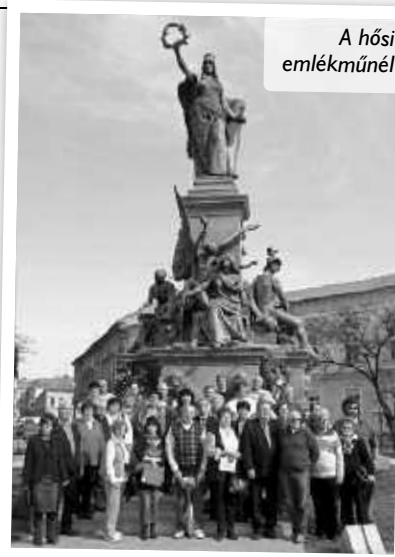
A hősi emlékműnél

Másnap reggeli után kezdődött a szőlőprogram. A mintegy 15 km-re lévő Ménes nevű település szép fekvésű dombjain megnéztük a klasszikus ültetvényeket. A cégnek (Wine Princess) 60 ha szőlőterülete van, amelyen folyamatos a felújítás. Mivel az itt termesztett szőlőkből készült borokból volt alkalmunk