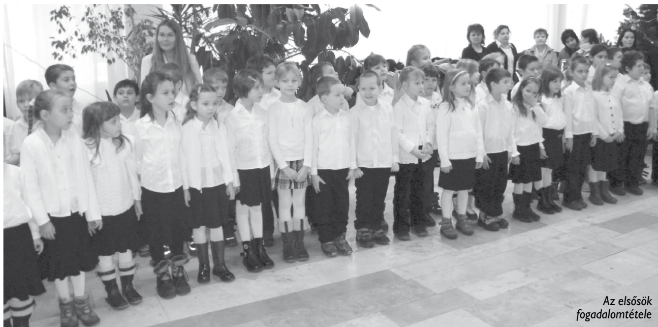
Az elsősök fogadalomtétele