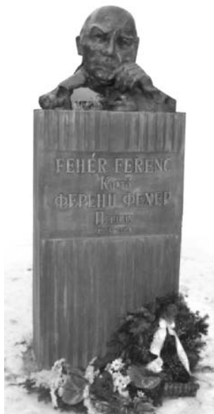
Fehér Ferenc szobrát Szilágyi László alkotta