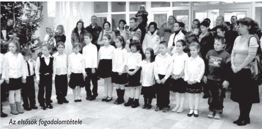
Az elsősök fogadalomtétele