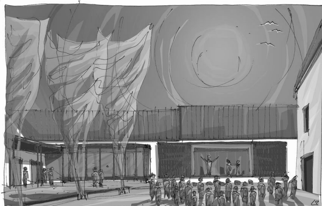
Terv a rendezvényközpont fejlesztésére