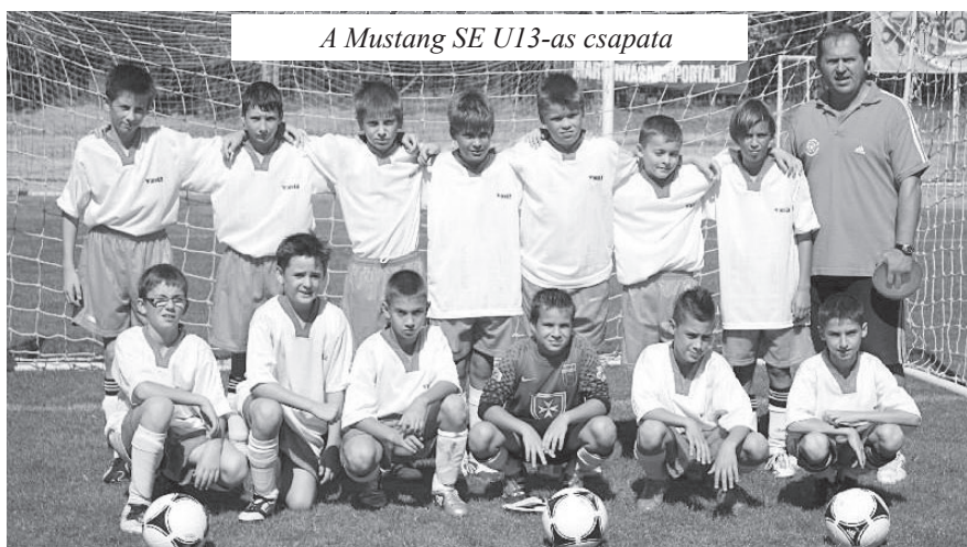
A Mustang SE U13-as csapata