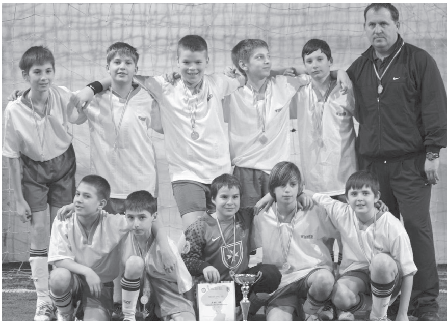
U13 FMLSZ Kupa győztes csapata