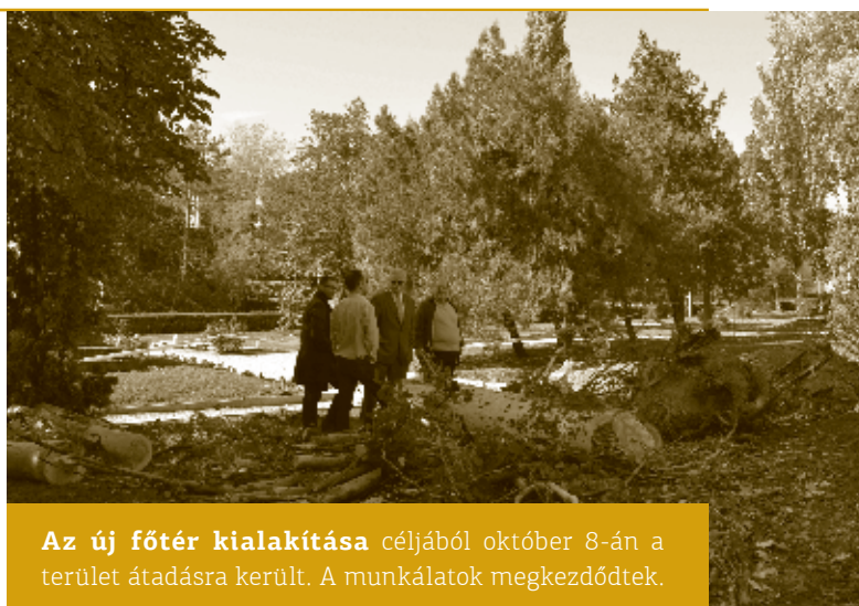
Az új főtér kialakítása céljából október 8-án a terület átadásra került. A munkálatok megkezdődtek.

A régi iskola felújítása is felgyorsult, remélem az ígért