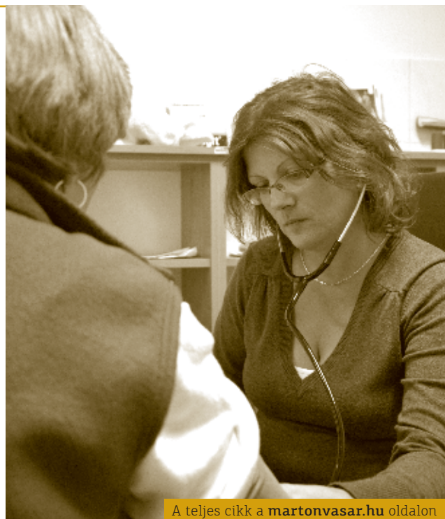
A teljes cikk a martonvasar.hu oldalon

Nem szoktam semmilyen kifejezett diétát javasolni. Az átlagos vegyes étrend megfelelő, ami nem túlzó semmilyen téren. Ha megfelelő mennyiségben fogyasztunk zöldséget, gyümölcsöt,