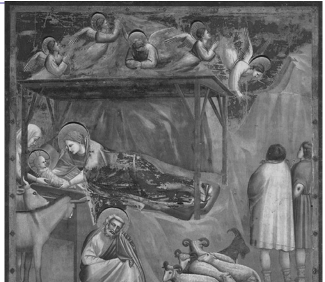
Giotto: Jézus születése

A nyugati egyház elutasította az apokrif evangéliumokat, de a két bába megjelenik a kis Jézus fürösztésekor. A betlehem-i csillagot eleinte csak a Háromkirályok imádásán,