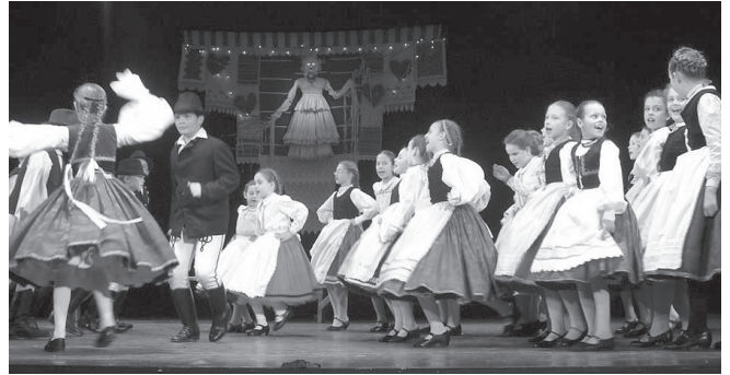
A Művészeti Iskola gyermekcsoportja

Luca napján tartotta a Százszorszép Táncegyüttes évrő bémutatóját Budapesten, a Hagyományok Házában. Ezen közreműködött a Művészeti Iskola gyermekcsoportja és a Tordasi Pillikék, a zenét a Tűz Lángja zenekar valamint a Felvonó együttes szolgáltatta.