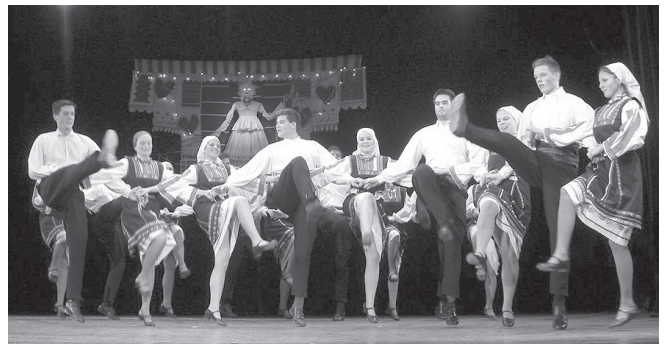
Bolgár táncok a Sop vidékéről