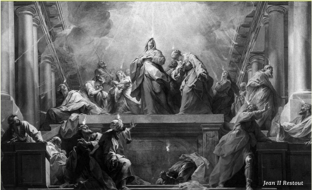
Jean II Restout