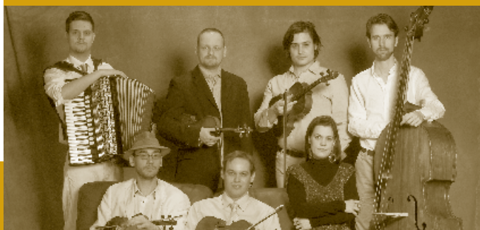
Buda Folk Band