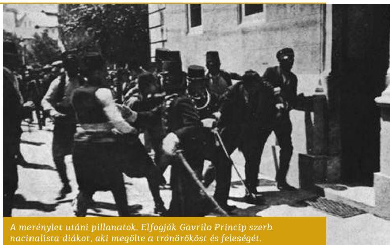
A merénylet utáni pillanatok. Elfogják Gavrilo Princip szerb nacionalista diákok, aki megölte a trónörökösét és feleségét.

A németek „villámháborús” tervei csődöt mondtak. 1914 őszén a Marne-folyó melletti nagy csatákban a franciák megállították a Párizs felé előretörő német csapatokat. „Állóháború” alakult ki. A szembenálló felek beásták magukat a lövészárkokba és időnként véres szuronyrohamokat indítottak az ellenséges lövészárkok elfoglalására, vagy áttörésére.