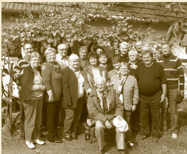
Az 1961-ben végzett VIII.b. osztály