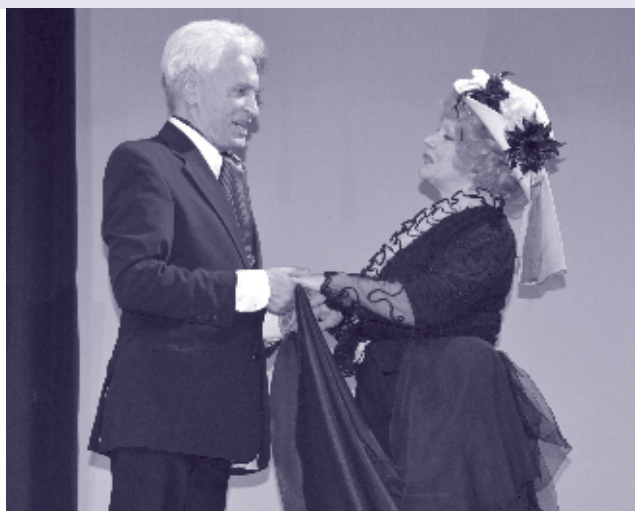
2015. január 23-án a Rendezvényközpontban kerül színpadra a darab.

A történet részei többé-kevésbé ismerősek a nagyközönség számára, talán ami újszerű – vagy a fiataloknak, a történelem iránt kevésbé fogékonyaknak teljesen új – az, ahogy ezt összefűzték. A darabban a szerző egy öt generációra visszanyúló felvidéki családragény formájában mutatja be, hogy nekünk, magyaroknak szerves, több mint egy évezredre visszanyúló történelmünk van ott, azon a területen.