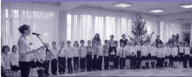
Az iskolai ünnepély az elsősök fogadalomtételével kezdődött.

December 16-án iskolánk névadójának születésnapjára emlékeztünk