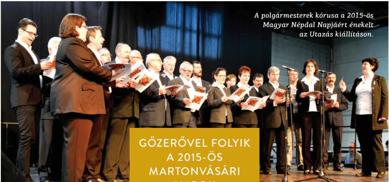
A polgármesterek kórusa a 2015-ös Magyar Népdal Napjáért énekelt az Utazás kiállításon.