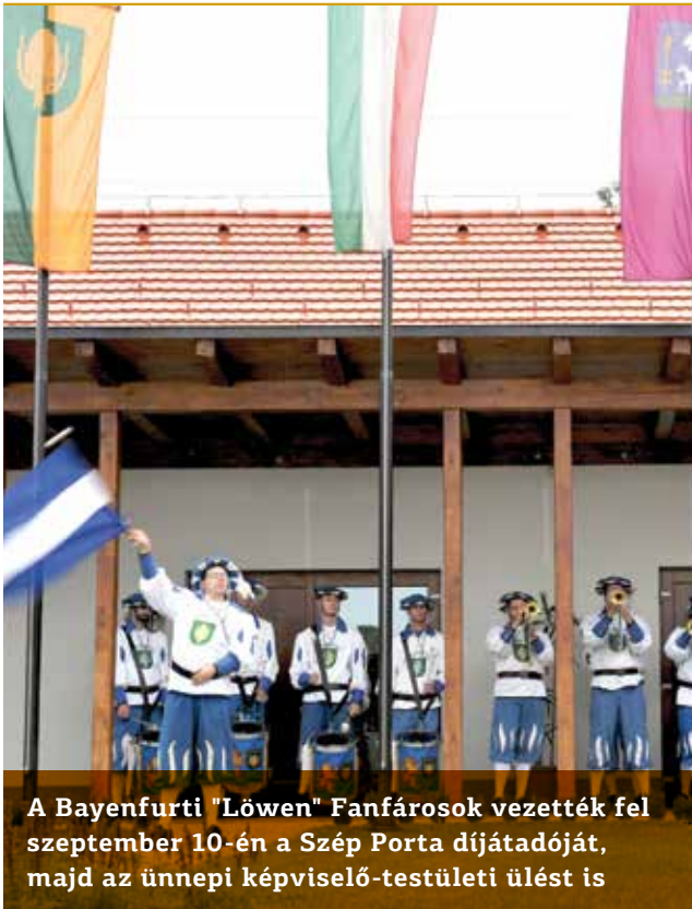
A Bayenfurti "Löwen" Fanfárosok vezették fel szeptember 10-én a Szép Porta díjátadóját, majd az ünnepi képviselő-testületi ülést is