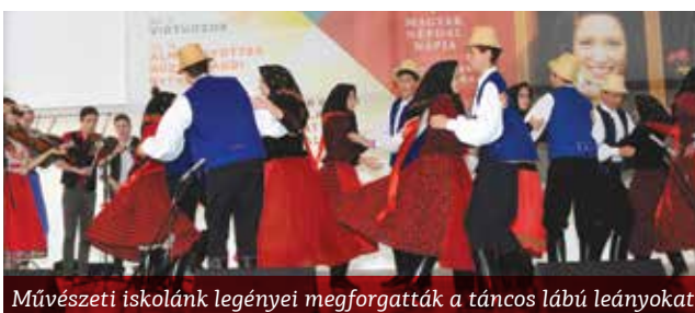
Művészeti iskolánk legényei megforgatták a táncos lábú leányokat