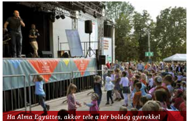
Ha Alma Együttes, akkor tele a tér boldog gyerekekkel