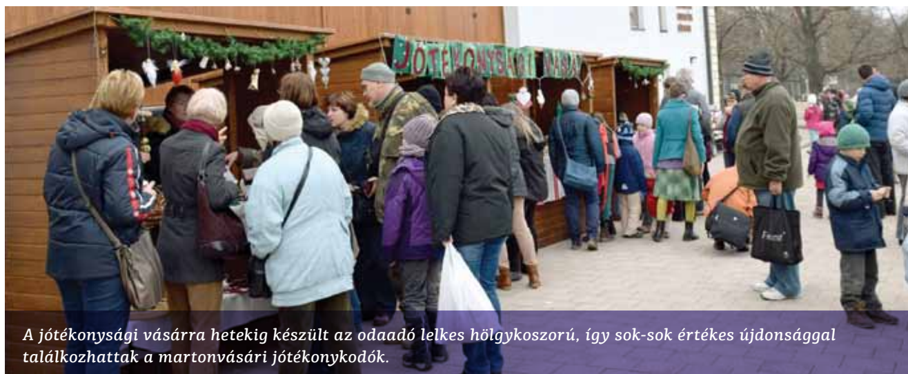
A jótékonysági vásárra hetekig készült az odaadó lelkes hölgykoszorú, így sok-sok értékes ajándékkal találkozhattak a martonvásári jótékonycodók.