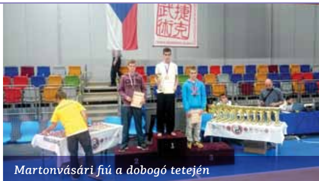
Martonvásári fiú a dobogó tetején