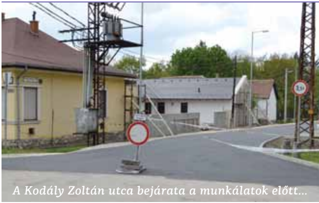
A Kodály Zoltán utca bejárata a munkálatok előtt...