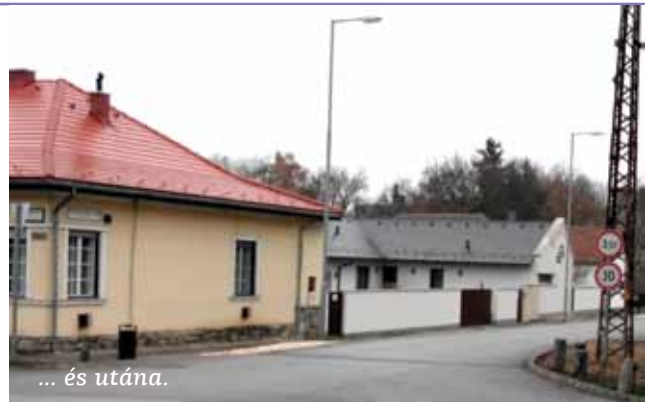
... és utána.