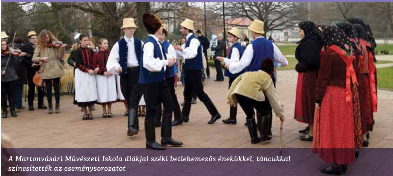
A Martonvásári Művészeti Iskola diákjai széki betlehemezős énekükkel, táncukkal színesítették az eseménysorozatot