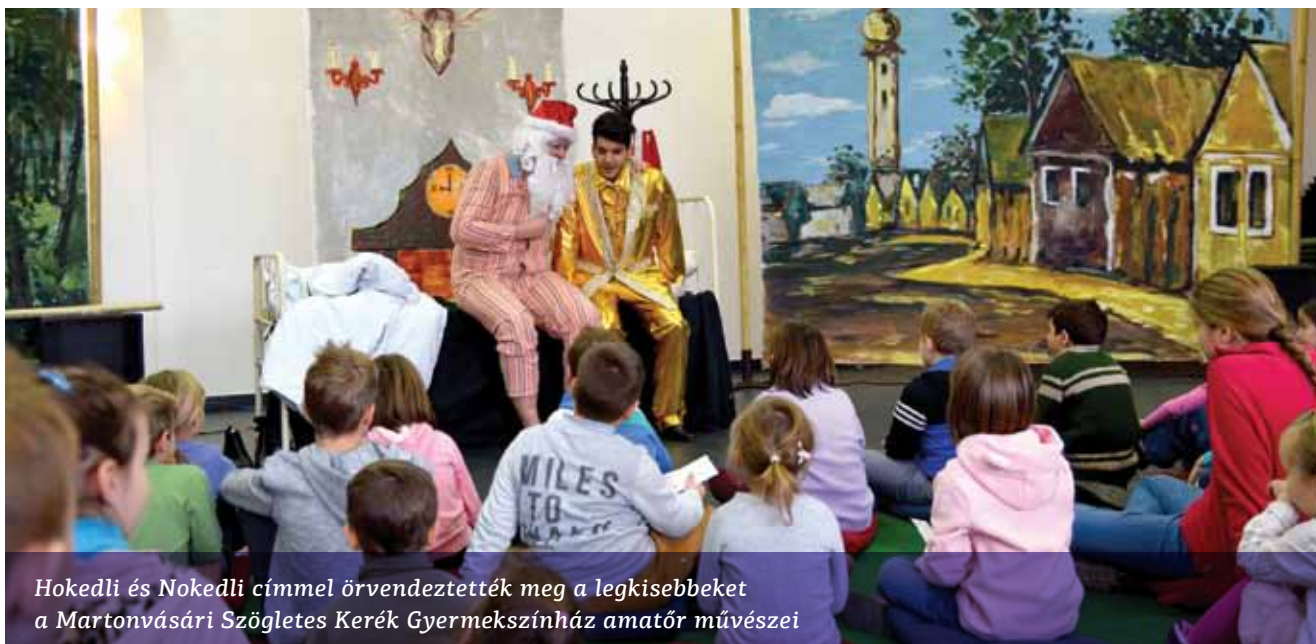
Hokedli és Nokedli címmel örvendeztették meg a legkisebbeket a Martonvásári Szögletes Kerék Gyermekszínház amatőr művészei