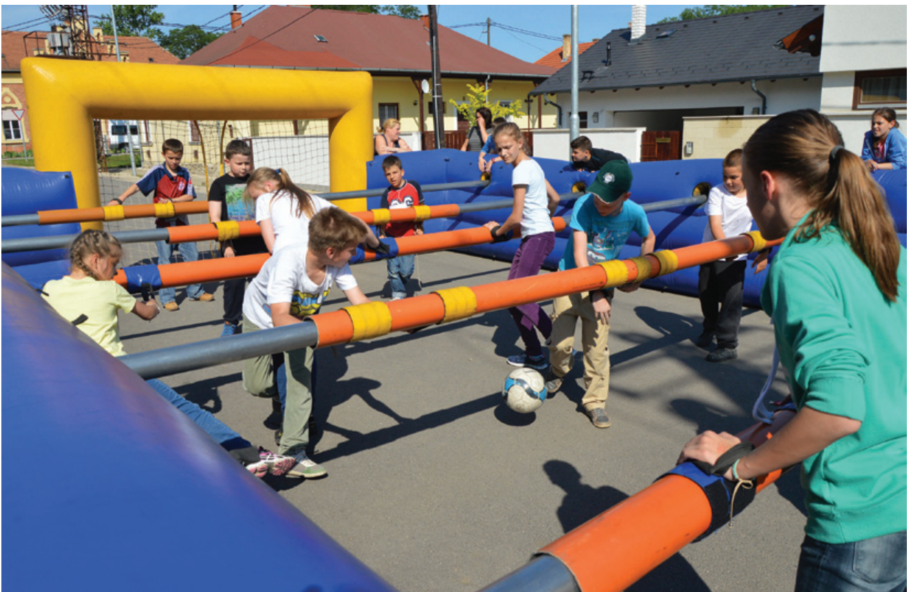
Az élő csocsó igazi csapatszellemet kívánt meg. A képen fiúk a lányok ellen játszottak. Egyik csapatnak sem volt kedve otthagyni a pályát...