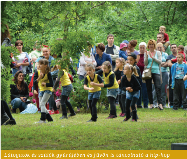
Látogatók és szülők gyűrűjében és fűvön is táncolható a hip-hop