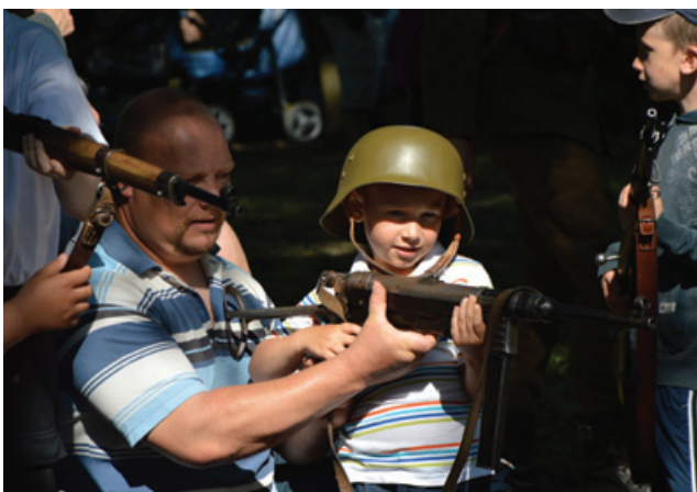
Nem csak a gyermekek, szüleik is érdeklődtek a fegyverek iránt