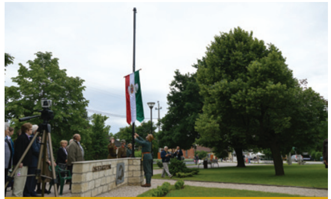
Nemzeti Összetartozásunk Napja ünnepi zászlófelvonással indult