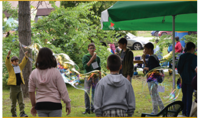
Az óriásbuborék készítése embert próbáló feladat