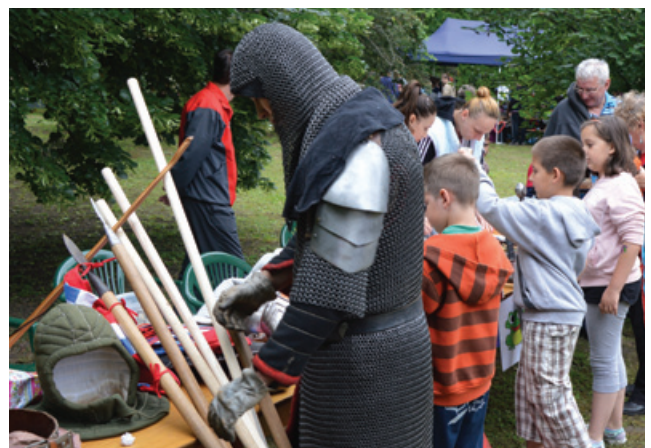
Harcra készülődik a középkori páncélos