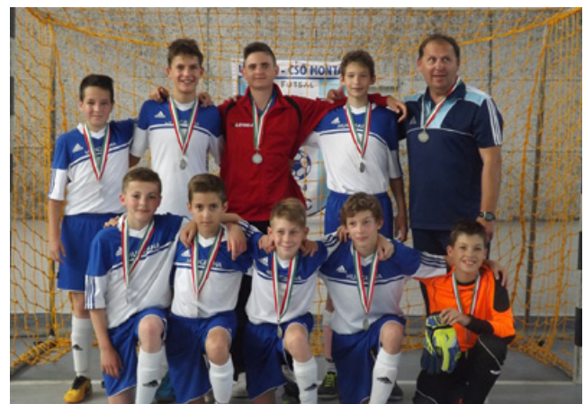
U13, 2. hely