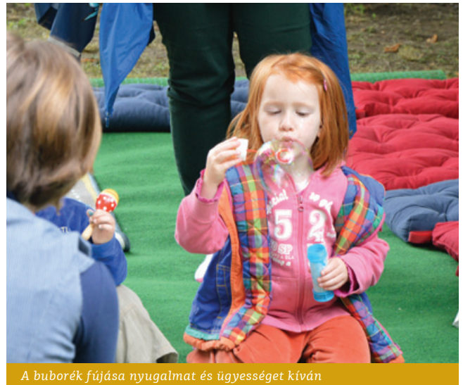
A buborék fújása nyugalmat és ügyességet kíván