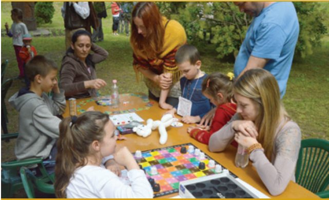
Játékok, amelyek a logikát fejlesztik