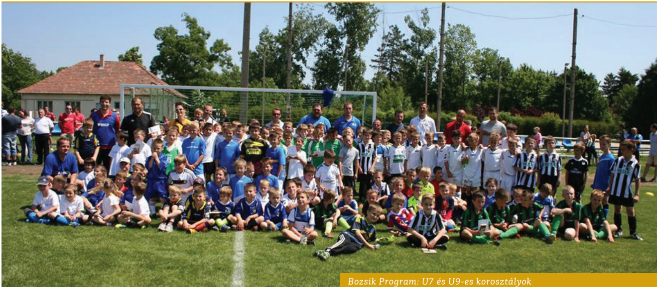
Bozsik Program: U7 és U9-es korosztályok