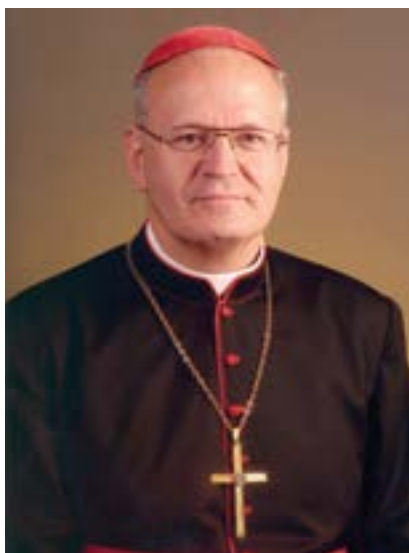
Erdő Péter bíboros