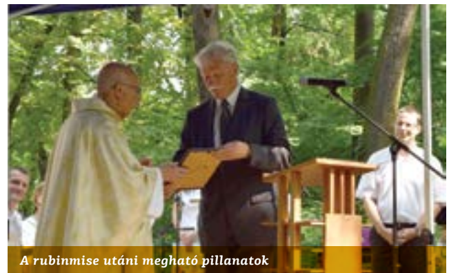
A rubinmise utáni megható pillanatok