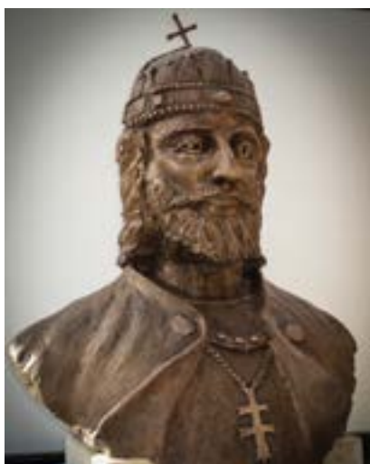
Berek Lajos szobra