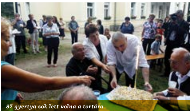
87 gyertya sok lett volna a tortára