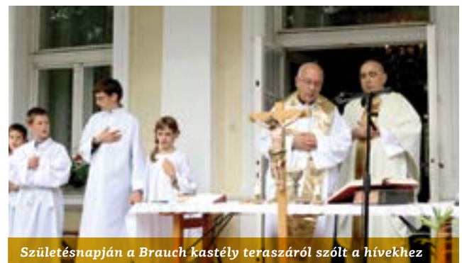
Születésnapján a Brauch kastély teraszáról szólt a hívekhez