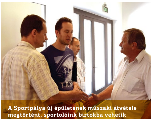
A Sportpálya új épületének műszaki átvétele megtörtént, sportolóink birtokba vehetik