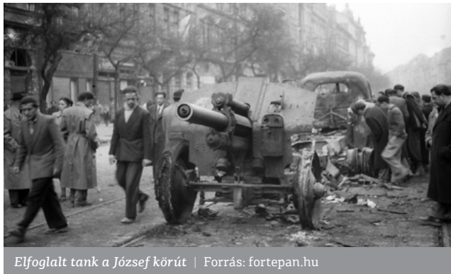
Elfoglalt tank a József körút

ZF Túl leegyszerűsített így a kérdés. Tanulni az tud, aki akar. Akiben egy merev gondolat, egy más fajta attitűd van már,