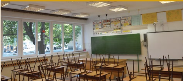
A földszinti tanterem megújítva várták a kicsiket. Az osztályokban a világítás felújítása is megtörtént