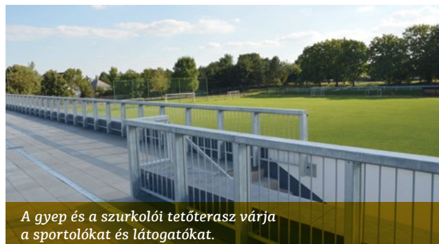
A gyeep és a szurkolói tetőterasz várja a sportolókat és látogatókat.