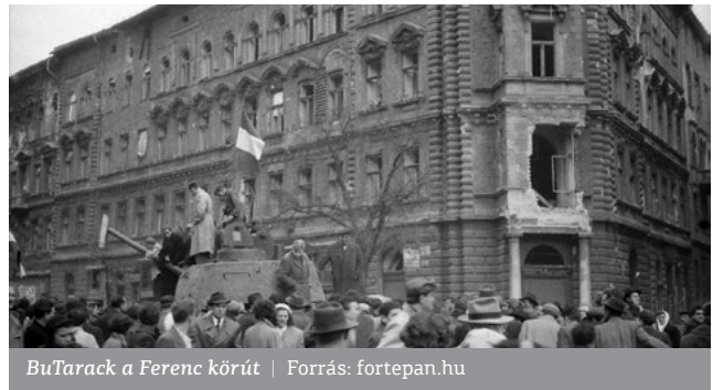
BuTarack a Ferenc körút

ZF A magyar történelemben visszanyúlva, amikor 1000 éve megjelentünk, csírájában a kelet és nyugat között a magántulajdon szentségének problémája jelen volt. A magyar királyság ezt használati tulajdonnal megoldotta. A királyok