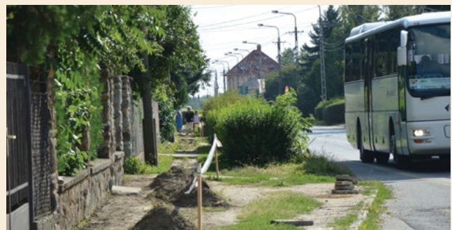
Járdafelújítások és útburkolat javítások várhatók az őszi folyamán. Az első a Budai út páratlan oldalát érintette