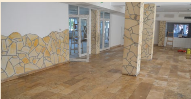
Végre méltó körülmények között ebédelhetnek gyermekeink az általános iskolában