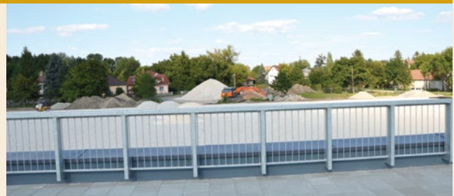
A műfüves pálya alapja. Két végpontja között maximum 2 centiméteres függőleges eltérés lehet