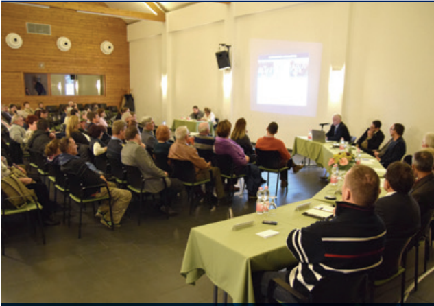
A közmeghallgatásra szinte megtelt a BBK Központ színházterme

mekkorában kerültek elhelyezésre, állapotuk koruknak megfelelő. A város egyéb utcáinak járdáival kapcsolatban is rámutatott, hogy a folyamatos karbantartás azok állapot megőrzését segíti, amit sokan elhanyagolnak. A szándék, a cserére itt is adott, költségvonzata azonban igen magas, így ütemezve terv szerint történik majd meg.