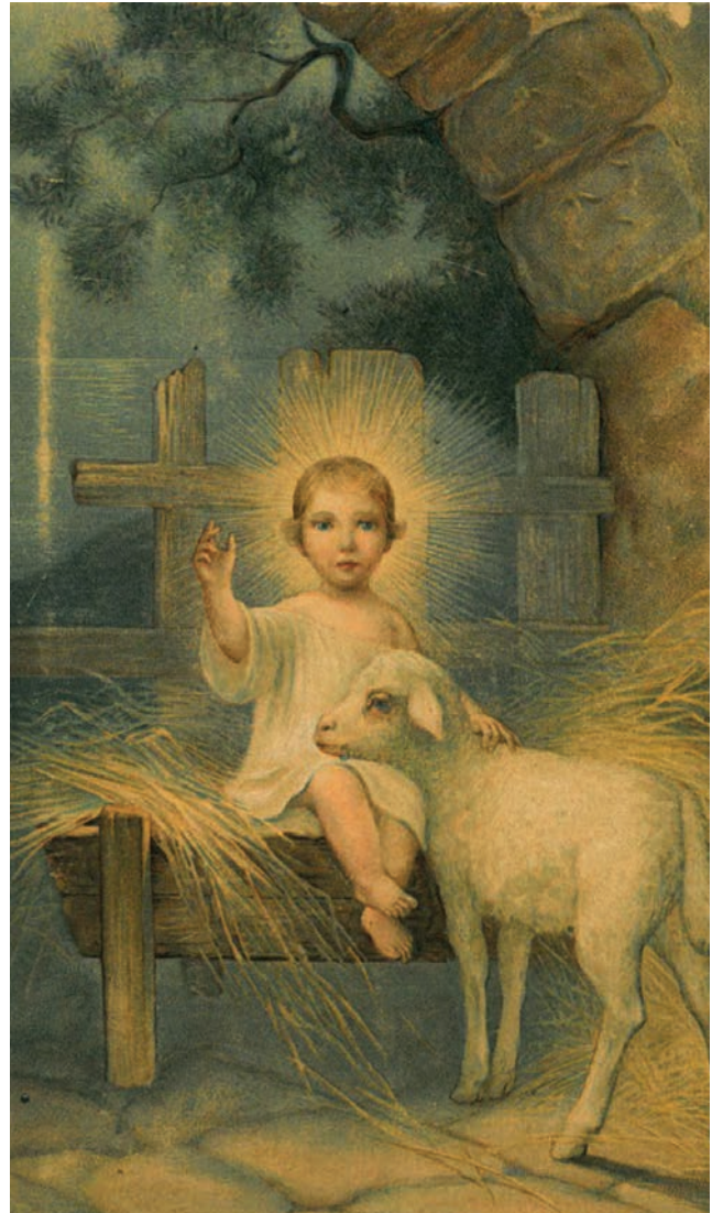
Két világháború közötti katolikus képeslap