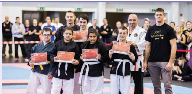
Október 22-én a törökbálinti sportközpont adott otthont a 21. Hanshi Kupának, amelyen bemutatót tartottunk

Színvarázs zenekarunk több felkérésnek (Tárnok, Biatorbágy) is eleget tett a zene világnapja alkalmából, most pedig az ad-