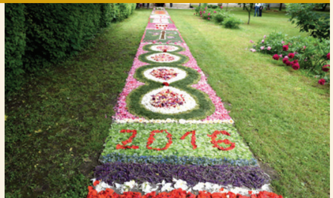
Köszönjük mindenkinek, aki az úrnapi virágszőnyeghez hozzájárult! Köszönjük a virágszirmokat, a hajnali munkát, a lelkesedést, ismét méltóképpen tudtuk elkészíteni az Úr útját.