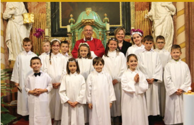
Pünkösdvasárnap tizennygy gyermek járult az első szentáldozáshoz. Életükre Isten áldását kérjük!