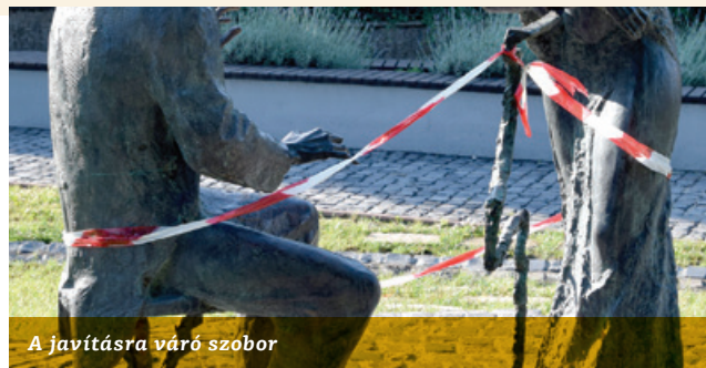
A javításra váró szobor

Persze az ilyen dolgok mindnyájunk felelősségét felvetik. Talán nekünk is erélyesebben kellene rászólnunk az utcán szem-