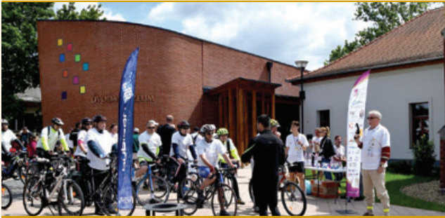
Polgármesterünk hármass szerepet vállalt. Átadta a díjakat a félmaratont maguk mögött tudóknak, ellőtte a kerékpáros futamot, majd a mezőny után eréd és letudta a 20 kilométert