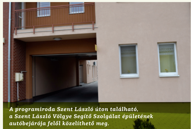
A programiroda Szent László úton található, a Szent László Völgye Segítő Szolgálat épületének autóbéjárója felől közelíthető meg.

A programiroda széles területi lefedettséggel rendelkezik. Munkatársai olyan ügyfélközpontú tanácsadói tevékenységben szereztek tapasztalatot, amely alkalmassá teszi őket a fejlesztési források hatékony felhasználásához való aktív hozzájárulásra.