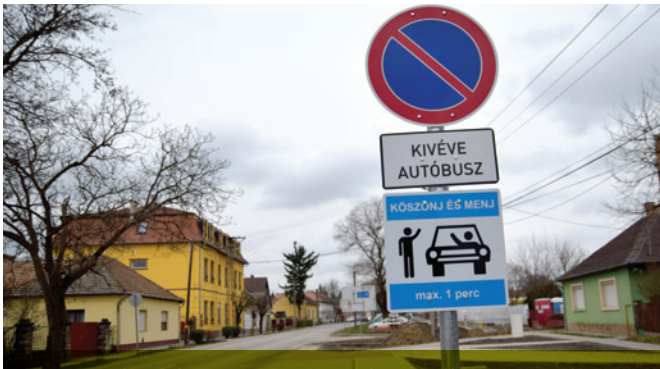
A Szent László úton, az iskola közelében autóbusz parkoló került kialakításra, alatta a KÖSZÖNJ ÉS MENJ táblával. Ha betartjuk a max 1 perces várakozási időt, egymáson segítünk