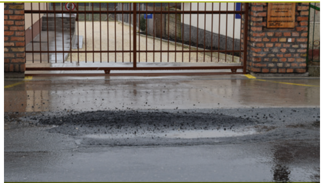
Sajnos a Hunyadi úton, az ott közlekedő tehergépjárművek már másnapra kikezdtek az ideiglenes javítást