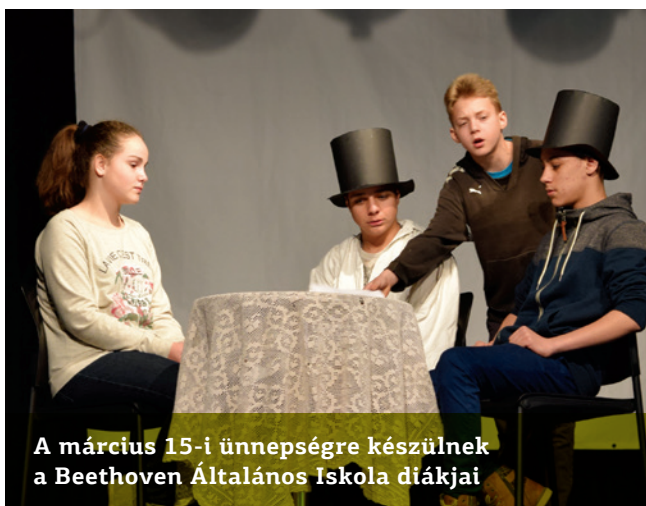
A március 15-i ünnepségre készülnek a Beethoven Általános Iskola diákjai

Hétről hétre összesen 30 fős 7-8 éves fiú- és leánysereg látogatja az edzéseket.