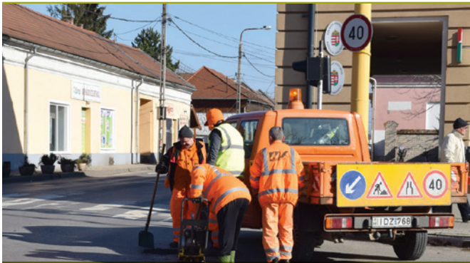
Az első melegebb napokon a közútkezelő is elkezdte utjaink kátyúzását