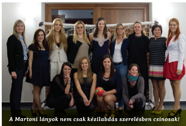
A Martoni lányok nem csak kézilabdás szerelésben csinosak!

Tombola nyereményeket nagy számban kaptunk szolgáltatóktól, magányszemélyektől, helyi érdekltségű vezetőktől és természetesen egyesületi tagjainktól is. Itt ragadnánk meg az alkalmat, hogy köszönetet nyilvánítsunk támogatóinknak, akik olyan sokan voltak, hogy fel se tudunk sorolni mindenkit, szívet melengető volt a sok segítség!