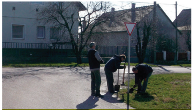
Az elkövetkező napokban több tucat közlekedési táblát helyeznek el a MartonGazda dolgozói.