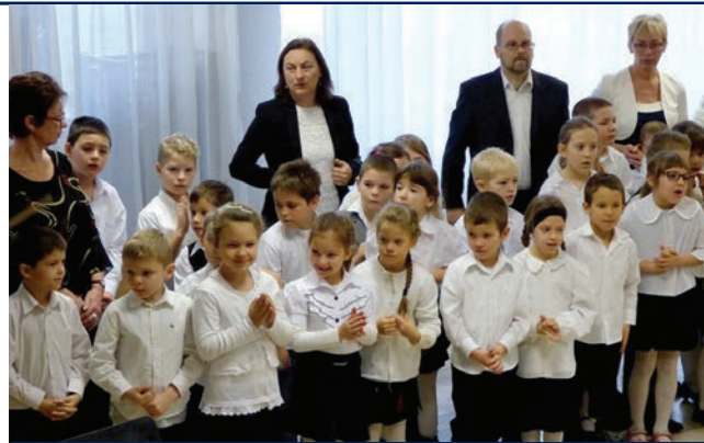
Az elsősök avatása az egyik legnagyobb izgalommal várt esemény

az iskolások életébe. Bízunk benne, hogy az alkotó délelőttön számos gyönyörű, szívvel és lélekkel készített ajándék a karácsonyfák alá is bekerült, hiszen évről évre minden szülő számára a legkedvesebb ajándékok között kapnak helyet a gyerekek által készített remekművek.