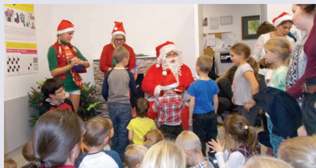
A dolgozók gyermekeinek örömeire ellátogatott hozzánk a Mikulás

Hivatalunkat 2016. 01. 01. és 12. 14. közötti időszakban 42 ezer 885 ügyfél kereste fel, 49 770 ügyben született döntés (határozat, végzés, levél, továbbítás stb.). Ezek a számok nem tartalmazzák azokat az eseteket, amikor az ügyfelek személyesen kértek tájékoztatást. A hivatal ügyintézői hatáskörükben eljárva személyesen 12 379 esetben adtak felvilágosítást ügyfeleink részére. A fentiekén kívül, az állampolgárok kb. 30 000 esetben kértek és kaptak telefonon, e-mailben tájékoztatást. Emellett március elején átadásra került a Foglalkoztatási Osztály felújított épülete Ercsiben, augusztus 25-én pedig a Kormányablakban köszönthettük a nyitás óta az ötvenezredik ügyfelet.