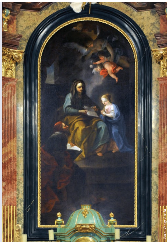
A főoltár feletti képen Szt. Anna férjével Szt. Joachimmal, valamint Szűz Mária látható.