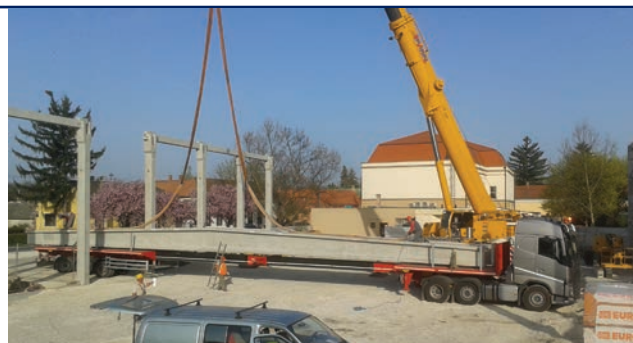
A legnagyobb technikai bravúr a betongerendák beemelése volt

eseményen, minden igazolt kézilabdás korosztály pályára léphetett. Külön öröm, hogy azóta már mindegyik kézilabda csapatunk szerzett bajnoki pontot az új helyszínen.