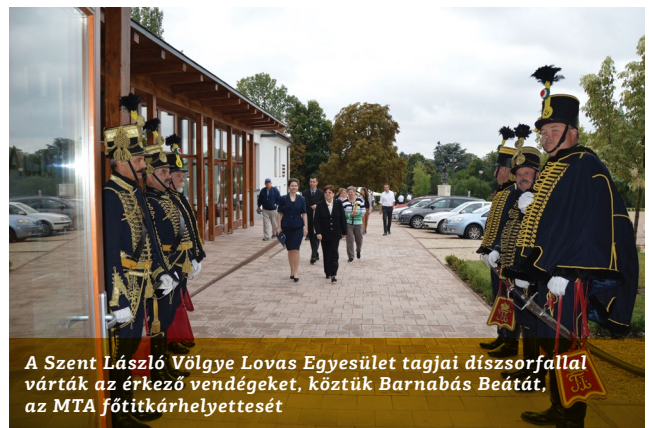
A Szent László Völgye Lovas Egyesület tagjai dízsorfallal várták az érkező vendégeket, köztük Barnabás Beátát, az MTA főtítkárhelyettesét