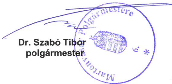
Dr. Szabó Tibor polgármester