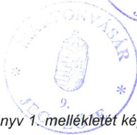
Miklósne Pető Rita aljegyző

(A rendelet mellékletei a jegyzőkönyv 1. mellékletét képezik.)